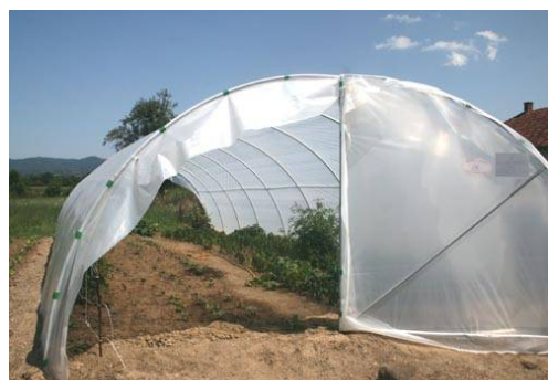
Croce Rossa di Kraljevo (Serbia) Serre per famiglie di contadini