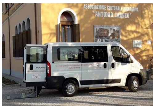
Ass. Culturale Ricreativa A. Carneo di Concordia Sagittaria Pulmino