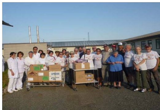
Ospedale "Redemptoris Mater" di Ashotsk (Armenia) Medicinali e attrezzature sanitarie