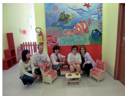
Nido d'infanzia di Olbia (alluvione 2013) Arredi e giochi