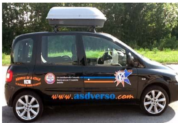
Associazione Verso di Borgo Virgilio (finalità locale con Camper Solidale Mantova) Pulmino per lo sport