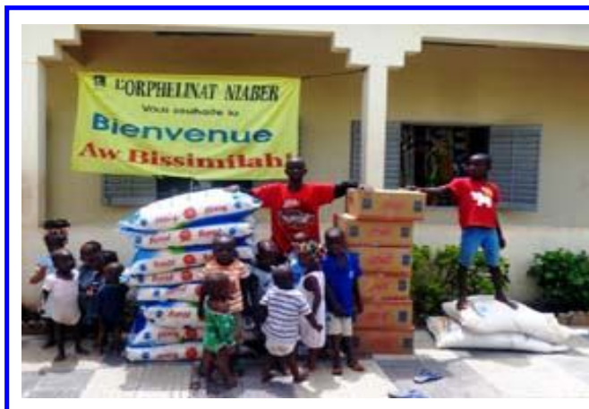
Orfanotrofio "Niaber" di Bamako (Mali) Alimentari